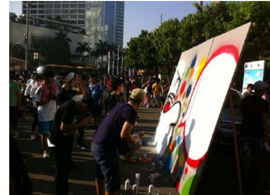
📍 Indonesia, junio de 2014

Le proporcionaremos un modelo de nota de prensa que puede usar para su acción, tanto antes como después de su realización. También pudiese contactar directamente a