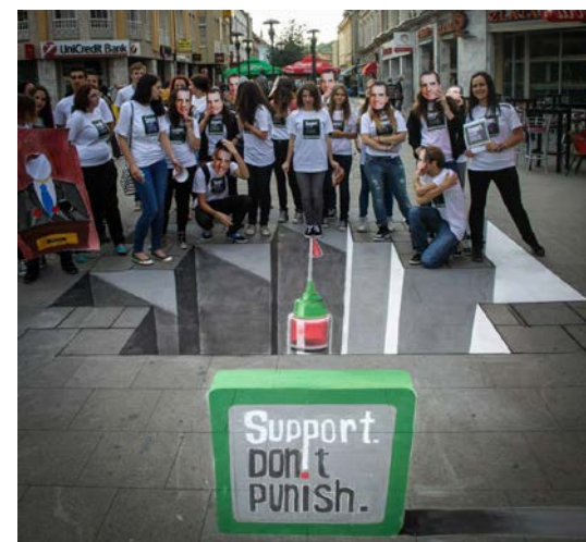
📍 Bosnia Herzegovina, junio de 2013

Contacte a otras organizaciones locales y personas que estén interesadas en la campaña – especialmente redes de personas que usan drogas o poblaciones afectadas. Organice una llamada o una reunión para acordar los planes, los roles que diferentes colaboradores tendrán, e identifica a una persona que sea la que lidere la coordinación. Solicite que todas las personas que participen visiten nuestro sitio web , Facebook y Twitter para que se familiaricen con la campaña.