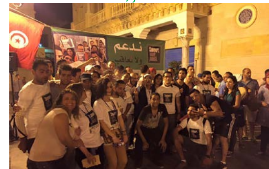
📍 Túnez, junio de 2015