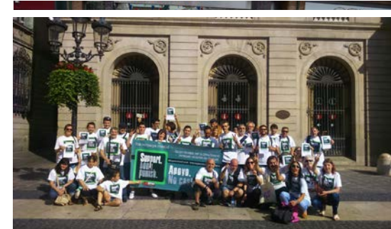
📍 España, junio de 2016

Dependiendo del tipo de evento artístico que se planee, necesitará considerar la necesidad de comprar o rentar material con antelación. Esto pudiese incluir, por ejemplo,