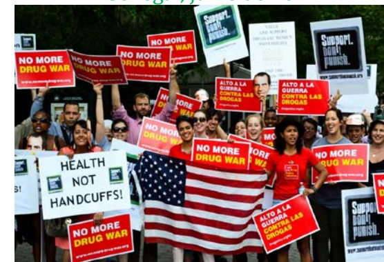
Estados Unidos, junio de 2014