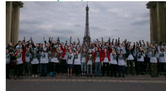
📍 Francia, junio de 2013