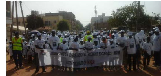
Senegal, junio de 2014

Favor de prioridad a su seguridad, la de sus socios y los participantes. Si la reunión o protesta requiere enfrentarse a la ley, bloquear calles o rutas, o arriesgarse a ser arrestado y ser objeto de violencia, entonces le pedimos considere una acción alternativa. Las reuniones, marchas y flash mobs son muy efectivas cuando están bien gestionadas, por lo que le sugerimos usar nuestra herramienta de evaluación de riesgos (por ahora, en inglés) para ayudarlo a controlar el evento y poner en marcha las salvaguardas y protecciones necesarias.