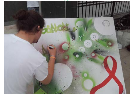
📍 Francia, junio 2016