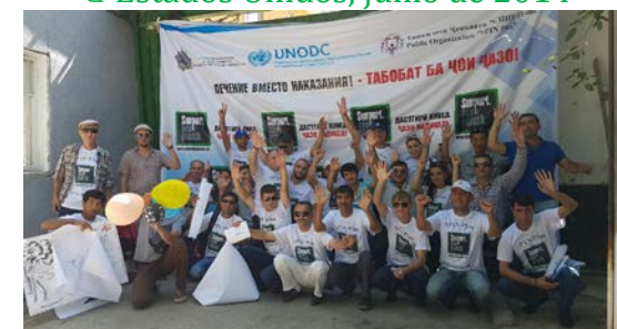
Tayikistán, junio de 2016