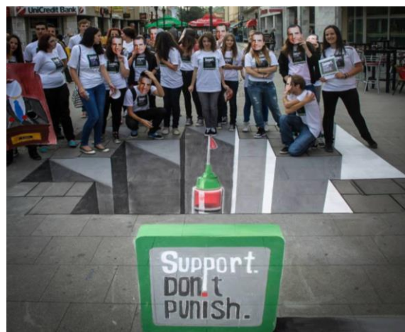
Tuzla, Bosna i Hercegovina