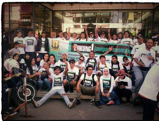
Kuala Lumpur, Malezija