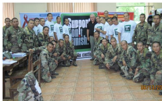
La Paz, Bolivija